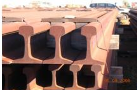
TRILHOS : HE 400/UHC 400/HE-X